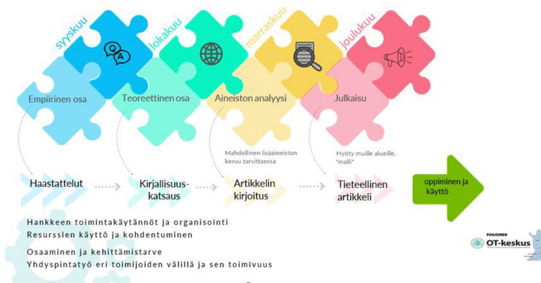
kuva 2. Mallinnus translationaalisesta HSS-tutkimusprosessista