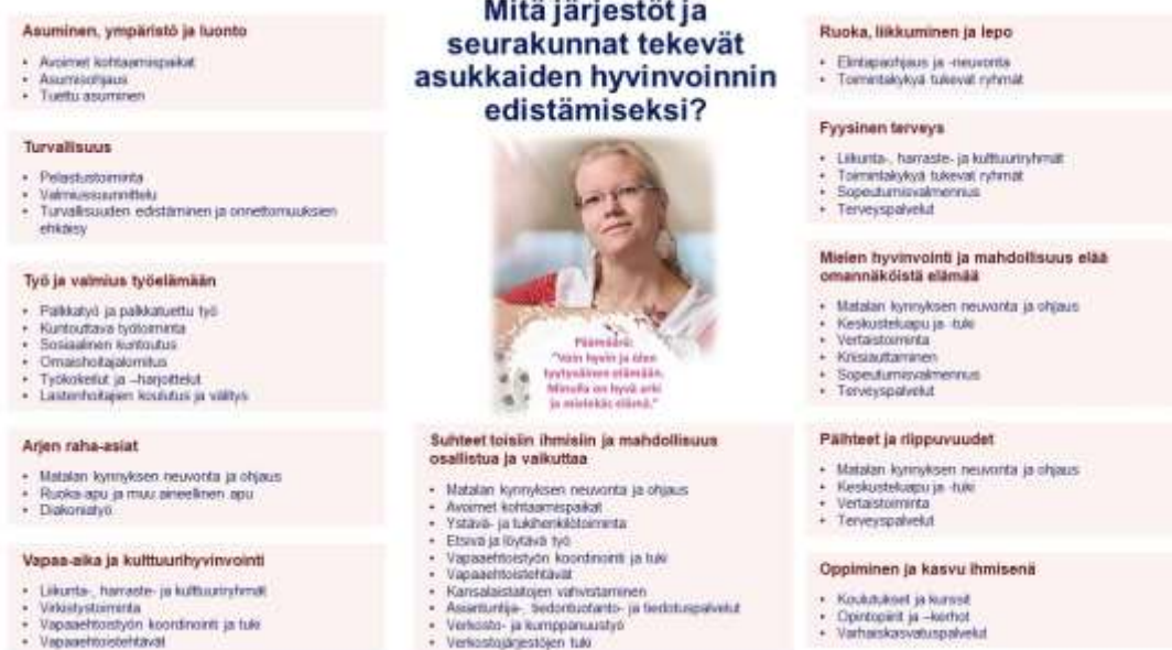
Kuva 1: Ihmisen hyvää arkea ja elämää edistävä järjestöjen ja seurakuntien toiminta

Eri alojen järjestöt ja seurakunnat edistävät hyvinvointialueen asukkaiden hyvinvointia, terveyttä ja turvallisuutta tarjoamalla mahdollisuuksia osallistua, toimia ja vaikuttaa. Järjestöt ja seurakunnat tarjoavat asukkaille muun muassa harrastus- ja virkistystoimintaa, koulutuksia ja tapahtumia ja vapaaehtoistoiminnan tehtäviä. Toiminta lisää sekä siihen osallistuvien, että sitä vapaaehtoistyöllään toteuttavien asukkaiden osallisuutta. Toiminnalla voidaan vähentää syrjäytymistä ja eriarvoisuutta ja kaventaa hyvinvointi- ja terveyseroja tarjoamalla toimintaa erityisesti niille asukkaille, joille on kasautunut eriarvoisuutta lisääviä tekijöitä.